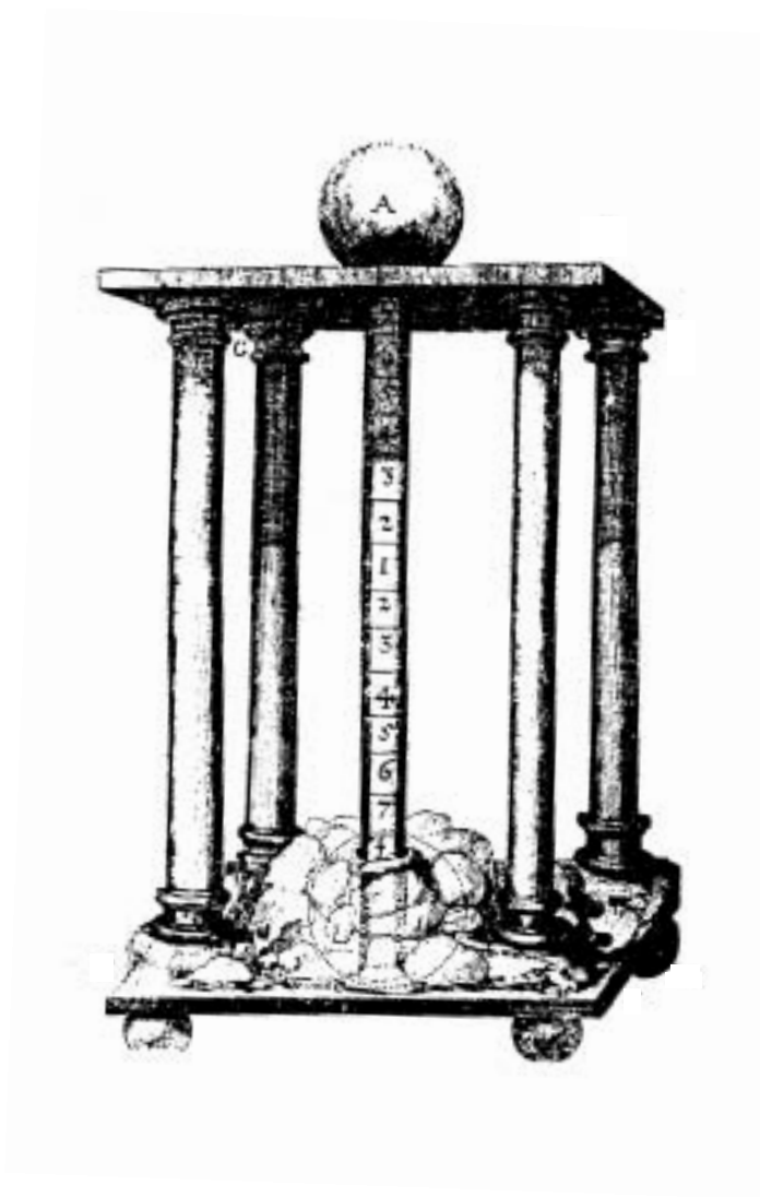
Fig. 2. Termómetro de R. Fludd. (Debus, 1987)

Pero estos eran para R. Fludd los usos vulgares del termómetro. Lo cierto es que él creía que había encontrado una prueba experimental de su teoría cósmica, al tiempo que un arma retórica o metafórica perfecta para convencer a los demás de tales verdades.